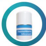
Silikon w Sprayu