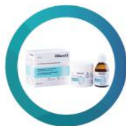
Akryl do napraw Villacryl S