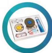
Zestaw do polerowania Hatho